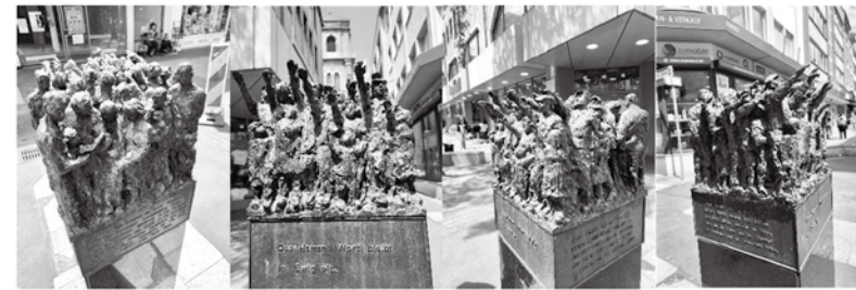
ゲマルケ教会前にある碑 撮影：市川ひろみ（2025年6月3日）